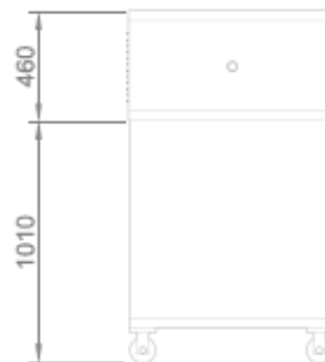
VISTA POSTERIORE + CELLA DI LIEVITAZIONE BACK VIEW + PROVER