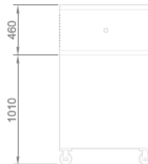
VISTA POSTERIORE + CELLA DI LIEVITAZIONE BACK VIEW + PROVER