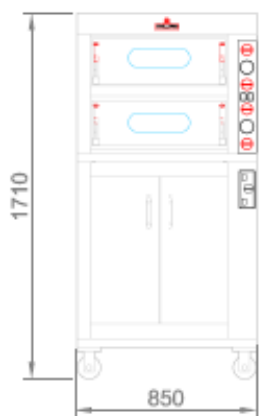
VISTA FRONTALE + CELLA DI LIEVITAZIONE FRONT VIEW + PROVER