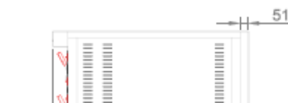
VISTA LATERALE + SUPPORTO SIDE VIEW + STAND