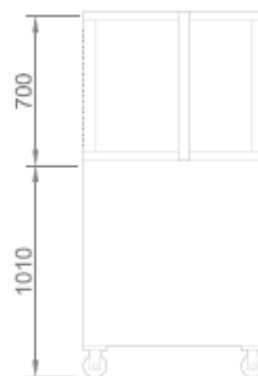
VISTA POSTERIORE + CELLA DI LIEVITAZIONE BACK VIEW + PROVER