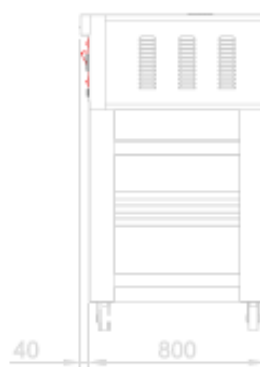
VISTA POSTERIORE + SUPPORTO BACK VIEW + STAND