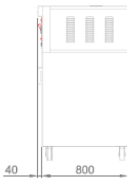
VISTA POSTERIORE + CELLA DI LIEVITAZIONE BACK VIEW + PROVER